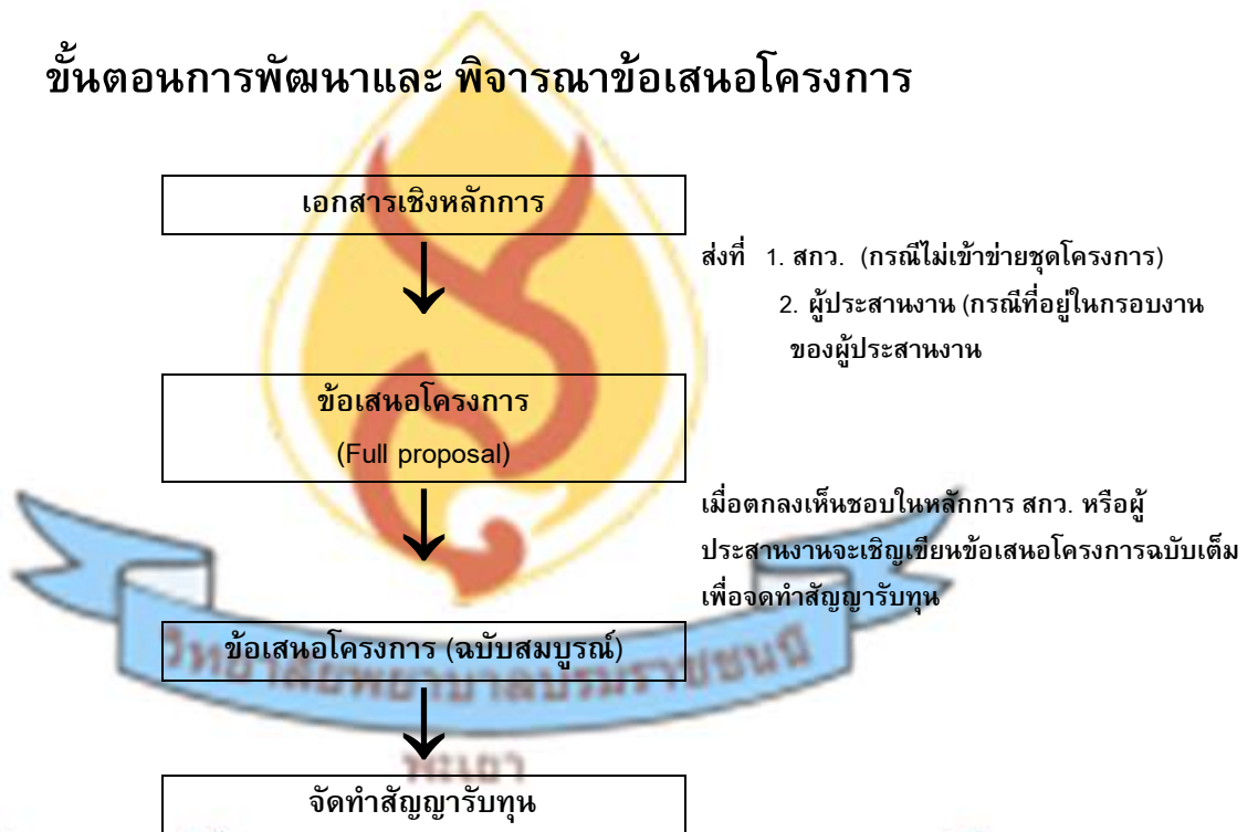
ภาพที่ 1 Flow ของขั้นตอนการพัฒนาข้อเสนอโครงการ